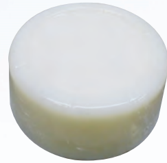
フレキシシ極 硬化物